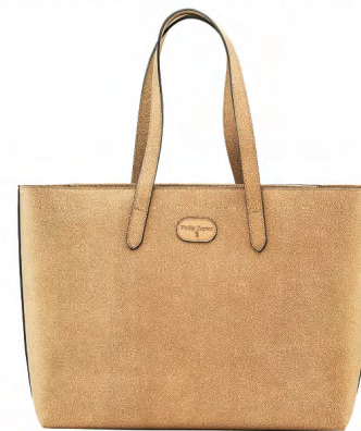
RAZZA COGNAC PZB-05-RC

Szerokość (góra): 44 cm; Szerokość (dół): 40 cm; Wysokość: 31 cm (53 cm z rączkami); Głębokość (dół): 13,5 cm; Głębokość (góra): 8 cm; Waga: 0,9 kg