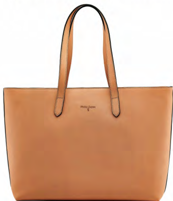
MUNICH ROSE PZB-03-MR

Ponadczasowy model klasycznej torebki damskiej włoskiego designu, który będzie towarzyszył wszystkim pokoleniom. Ta pojemna torba pomieści wszystkie niezbędne przedmioty codziennego użytku, których bezpieczeństwa będzie strzegł wygodny zamek błyskawiczny. Zorganizowana w przemyślany sposób, dzięki czemu możesz schować portfel, karty i klucze w osobnych kieszeniach. Możesz nosić ją w dłoni lub przez ramię.