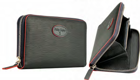
NAVY BLUE PZB-09-NB

Swoją elegancją portfele zawdzięczają niezwykle delikatnej strukturze skóry, zarówno na zewnątrz jak i wewnątrz. Funkcjonalny zamek błyskawiczny umożliwia łatwy dostęp do przegródek na dokumenty i karty oraz głównej przegródki na monety. Pojemny i idealnie zorganizowany do codziennego użytku, zaprojektowany jako kopertówka, dzięki czemu może być noszony w dłoni.