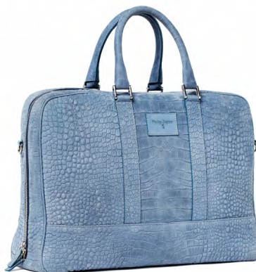
NUBUK JEANS PZB-07-NJ

Torba biznesowa Philip Zepter to Twój atut na spotkaniach biznesowych. Niepodważalne jakość i design, a także wyjątkowy wygląd i tekstura skóry krokodyla. Niebieski kolor torby będzie pasował do każdej stylizacji. Praktyczna dzięki wielu kieszeniom i centralnej przegrodzie zapinanej na zamek. Wyposażona w wygodne ręczki oraz pasek, dlatego można ją nosić również na ramieniu. Jest wodoodporna i odporna na kurz.