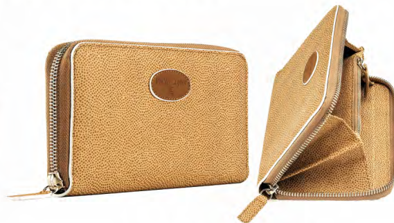
RAZZA COGNAC PZB-08-RC

Szerokość: 2,5 cm; Długość: 19,5 cm; Wysokość: 11,5 cm; Waga: 0,35 kg; Ilość przegród na karty: 8