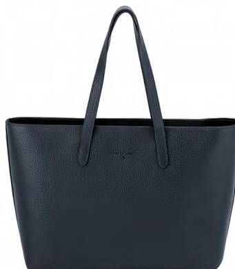
NAVY BLUE PZB-04-NB