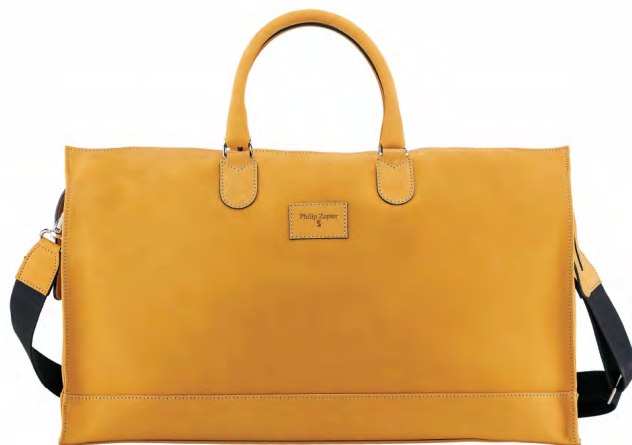
NUBUK ŻÓŁTY PZB-06-11

Lekka i wystarczająco pojemna również na dłuższe podróże. Wykonana ze skóry nubukowej odpornej na wodę i kurz. Idealnie sprawdzi się podczas podróży samolotem. Wykonanie ręczne najwyższej jakości. Włoski design i elegancja. To przykład podróżowania w stylu. Torbę można nosić w dłoni lub na ramieniu.