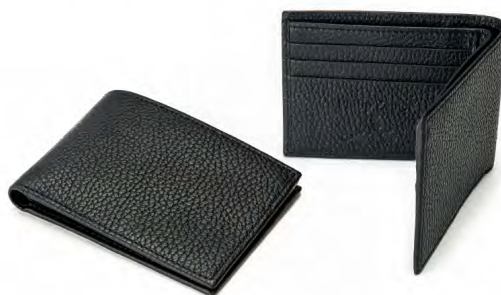
DARK BLUE PZB-10-DB

Szerokość: 2,5 cm; Długość: 19,5 cm; Wysokość: 11,5 cm; Waga: 0,35 kg; Ilość przegród na karty: 8